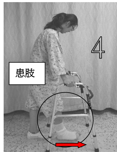
圖六 患肢向前移動 不超過助行器