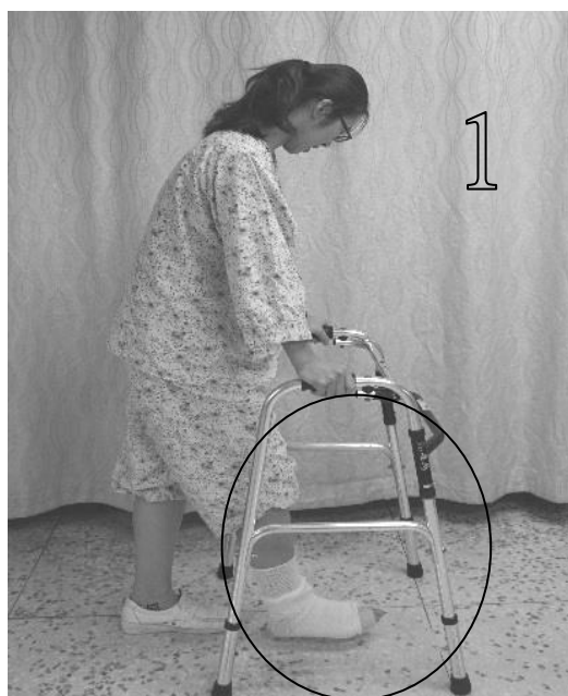
圖八 患肢抬高或彎曲 不要觸碰地面站立

(3)雙手下壓助行器，利用雙手及健肢力量，患肢往前盪不超過助行器前腳，健肢向前移動一步，停留在助行器前後腳中間，勿超過助行器，如圖十。