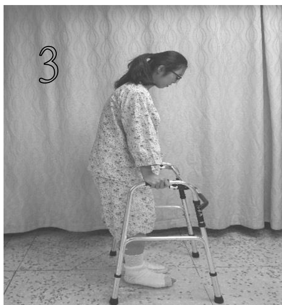
圖十 健肢向前一步不超過助行器