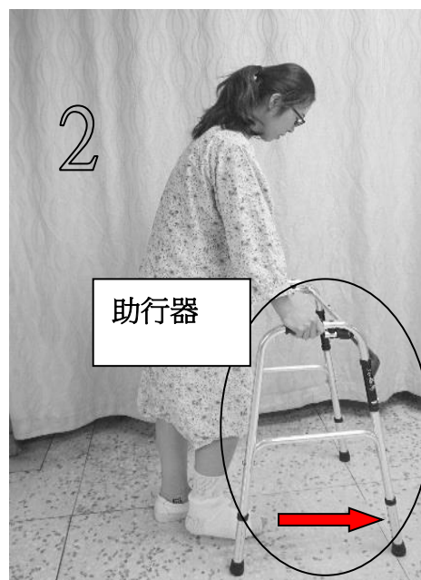
圖九 移動助行器向前一步