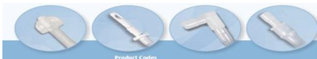
鈕扣型裝置腹內部份